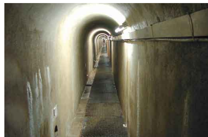
Blick in den Kontrollgang der Hauptsperre