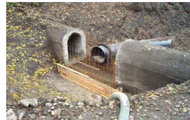
Anschluss einer Rohrleitung an den Stollen im Breitenbeektal

Die Anlagen des Überleitungssystems (Wehranlagen, Düker und Ausleitungsbauwerk) werden saniert und den erhöhten betrieblichen Anforderungen angepasst.