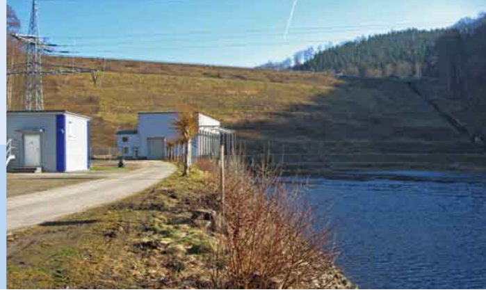
Blick vom Unterwasserbecken auf Kraftwerk, Damm und Hochwasserentlastung