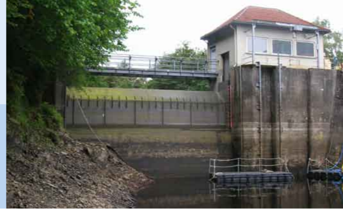
Ansicht der Wehranlage des Unterwasserbeckens