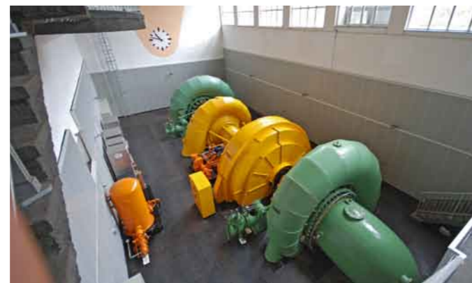
Blick in die vorhandene Kraftwerkshalle

Für den Sonderbetriebsplan und für die Umsetzung der Teilmaßnahmen wurden vom NLWKN als zuständige Talsperrenaufsichtsbehörde mehrere Genehmigungen eingeholt.