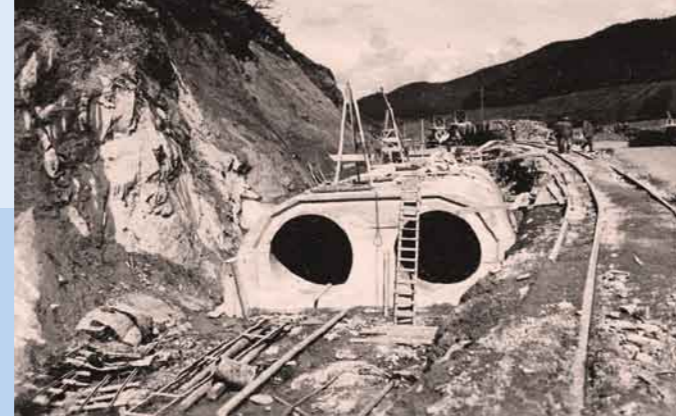
Bau der Betonkerndichtung der Hauptsperre – Blick von der Luftseite