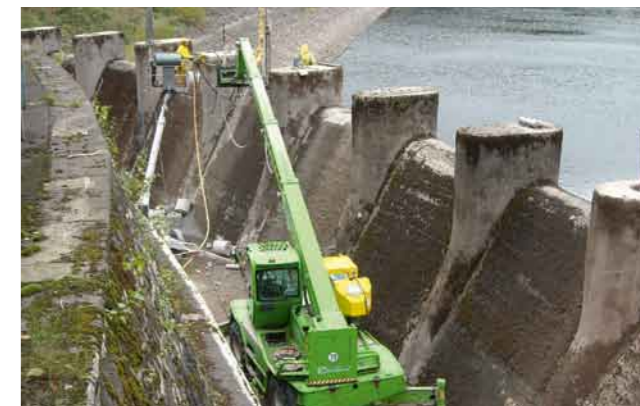
Setzen von Dauerfelsankern in dem Einlaufbauwerk der Hochwasserentlastungsanlage

Um eine Entleerung der Hauptsperre zur Durchführung der Arbeiten an den Entnahmeleitungen und der Wehranlage des Unterwasserbeckens zu vermeiden, wird der obere Speicherraum durch „Rückwärts-Nutzung“ des Überleitungsstollens bewirtschaftet. Die Abgabe erfolgt dann über die Breitenbeek und Sperrlutter in die Oder. Zur Steuerung von Hochwasserereignissen werden zwei Schlitze genutzt, die im Einlaufbauwerk der Hochwasserentlastungsanlage erstellt worden sind. Das Wasser fließt dann durch das Baufeld im Unterwasserbecken. Auf diese Weise wird der reguläre Betrieb auch während der Bauzeit nachgebildet (Sonderbetriebsplan).