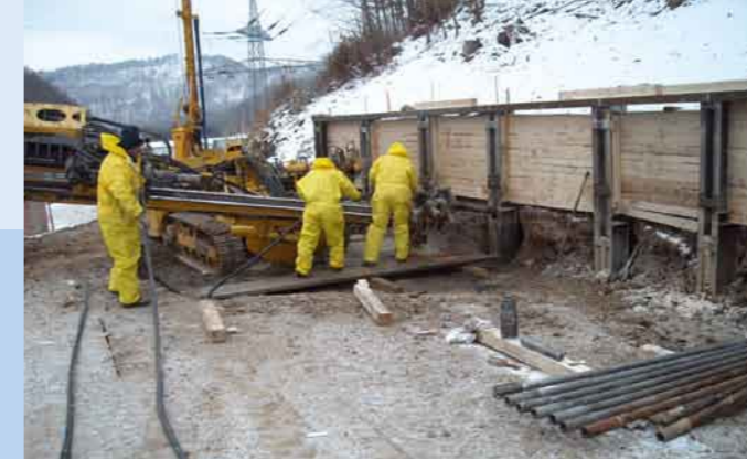
Setzen der rückwärtigen Verankerung für den Baugrubenverbau