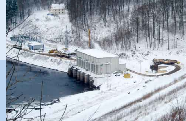
Blick auf das Kraftwerk mit Bautätigkeiten (Dezember 2010)