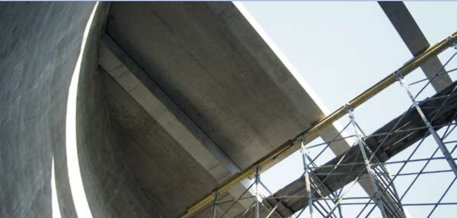
Dachkonstruktion des neuen Wasserhochbehälters in Groß Brunnsrode.

Sie sind unverzichtbar für eine zuverlässige Versorgung mit Trinkwasser: Bauwerke. Von der Gewinnung und Aufbereitung über die Speicherung bis zur Verteilung – in allen Abschnitten der Versorgungskette sind neben Anlagentechnik auch funktionale Bauwerke nötig. Neben Wasserwerken und Rohrleitungen stellen zum Beispiel Hochbehälter die klassischen Bauwerke der Trinkwasserversorgung dar. Bei ihrer Planung und Bauausführung ist besondere Sorgfalt erforderlich. Außerdem bedürfen sie einer qualifizierten Betreuung über ihren gesamten Lebenszyklus, ob beim Bau, bei einem eventuellen Umbau oder auch Rückbau, wenn ein Bauwerk nicht mehr benötigt wird. Nur so ist eine hochwertige, wirtschaftliche Nutzung der Bauwerke gewährleistet, die für einwandfreies Trinkwasser zur richtigen Zeit am richtigen Ort sorgt.