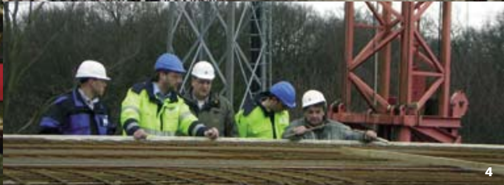
1 Nachtschicht inklusive: Der Bau des neuen Wasserhochbehälters in Groß Brunnsrode entstand durch Betonierung rund um die Uhr. 2 + 3 Innerhalb von vier Tagen und Nächten wurden im Dezember 2008 die Betonwände gegossen, um fugenfreie, glatte Wandinnenflächen zu bauen. 4 Präzise Arbeitsschritte und wirtschaftliche Bauweise zeichnen die Bauexperten der Harzwasserwerke GmbH aus.