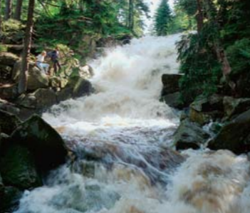
Ausflut am Oderteich bei Hochwasser