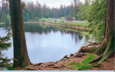
Das Wasser des Oderteichs treibt noch heute Wasserkraftwerke an